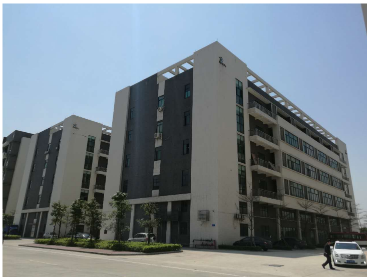
ASK工业自动化（中国）生产基地