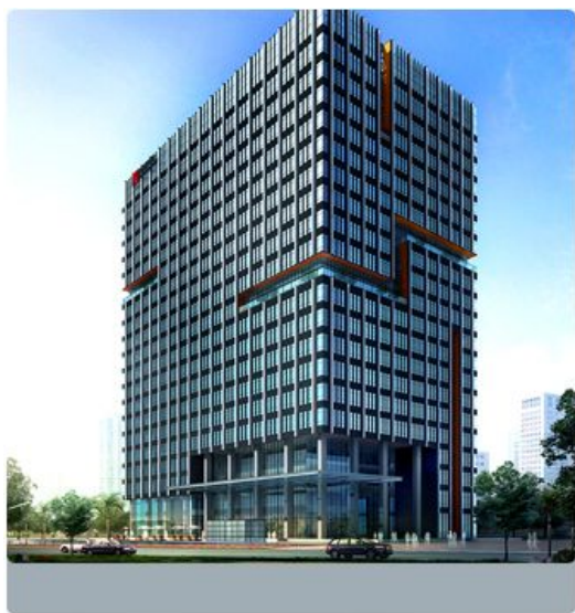
ASK工业自动化（中国）运营中心